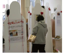
後援：警察庁・文部科学省 法務省・国土交通省

殺人・悪質な交通事故・いじめ・医療過誤・一気飲ませなどの結果、理不尽に生命を奪われた犠牲者が主役のアート展です。「命の重さ、尊さ」を訴え、犯罪のない社会を創造し、未来の命を守ることを目的としています。 犠牲者の発する声なきメッセージを受け止めてください。